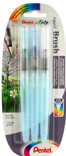
Aquash Stylo pinceau, kit de 3 pièces