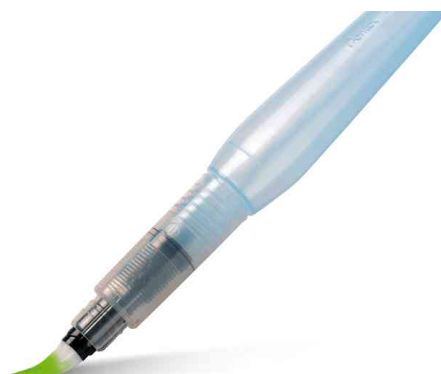
Visuel de référence: pointe