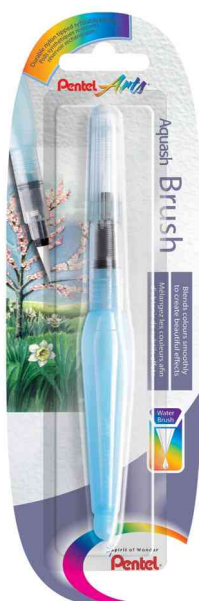
Visuel de référence: Aquash Stylo pinceau