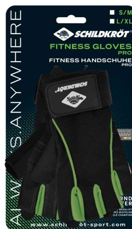
Gants de fitness "Pro", emballage