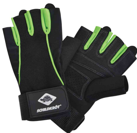
Gants de fitness "Pro"

- pour les professionnels en musculation et en fitness