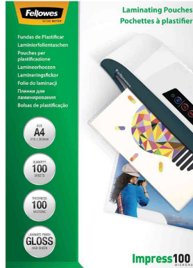
Laminierfolientaschen 200 mic (Impress)