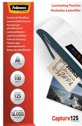
Laminierfolientaschen 250 mic (Capture)