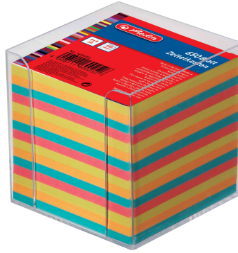
Zettelbox transparent, Papier farbig