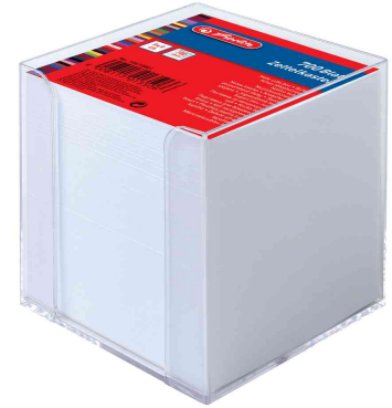
Zettelbox transparent, Papier weiß