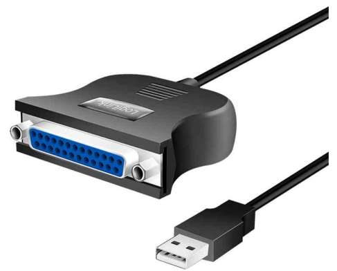
USB 1.1 Drucker kabel, 25 Pol Sub-D