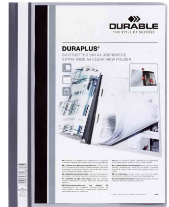
Schnellhefter DURAPLUS®, grau