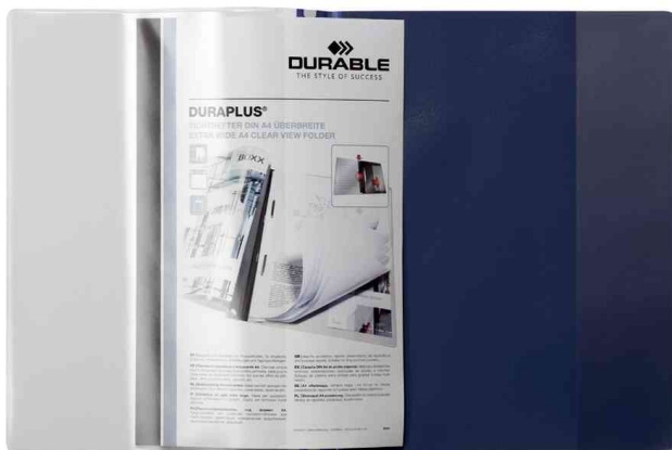
Schnellhefter DURAPLUS®, offen