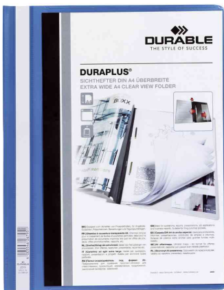
Schnellhefter DURAPLUS®, blau