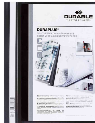
Schnellhefter DURAPLUS®, schwarz