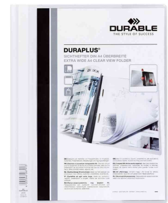
Schnellhefter DURAPLUS®, weiß