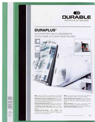
Schnellhefter DURAPLUS®, grün