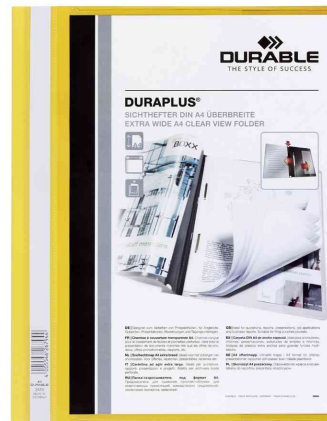
Schnellhefter DURAPLUS®, gelb