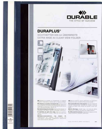
Schnellhefter DURAPLUS®, dunkelblau