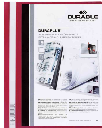
Schnellhefter DURAPLUS®, rot