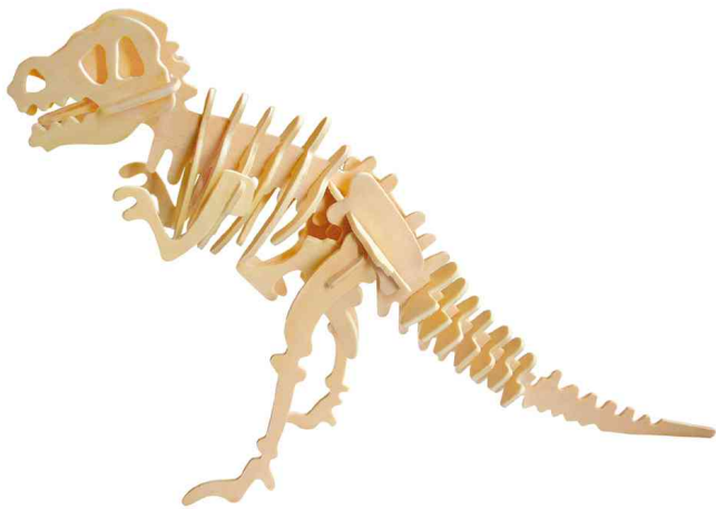
3D Puzzle "T-Rex Dinosaurier"

ACHTUNG! Nicht geeignet für Kinder unter 36 Monaten, wegen verschluckbarer Kleinteile.