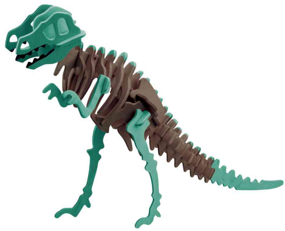
3D Puzzle "T-Rex Dinosaurier", Anwendung