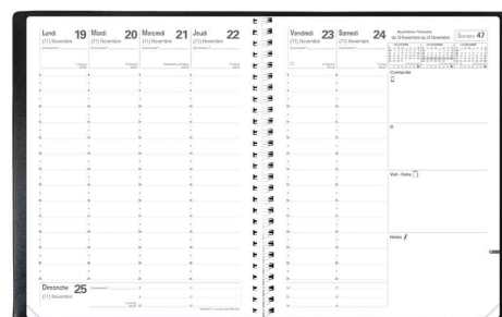
Agenda scolaire "Président S Sept", grille