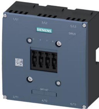
Lichtbogenkammer für 3RT1476