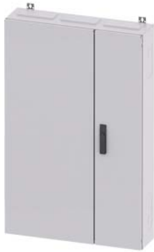
ALPHA 400 DIN, WANDVERTEILER, UP-SCHRANK, RAL 9016, IP31, SK1, H=1250 B=800 T=210