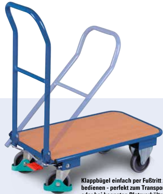
Klappbügel einfach per Fußtritt zu bedienen - perfekt zum Transport oder bei beengten Platzverhältnissen geeignet