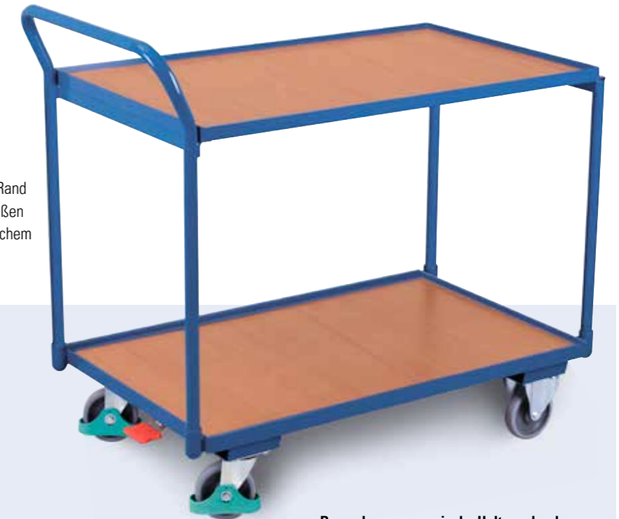
Besonders ergonomische Haltung durch den hochstehenden Griffbügel