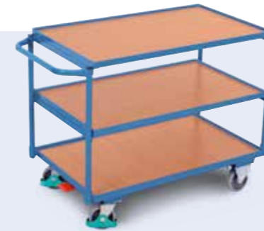
Der gerade Bügel erleichtert den Transport auch etwas sperriger Lasten