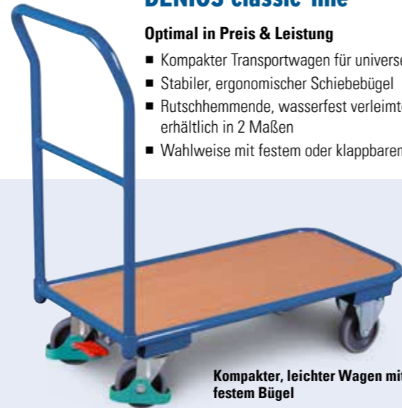
Kompakter, leichter Wagen mit festem Bügel