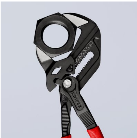
Schlüsselweite metrisch (Vorderseite) und zöllig (Rückseite) am Zangenkopf eingelaset