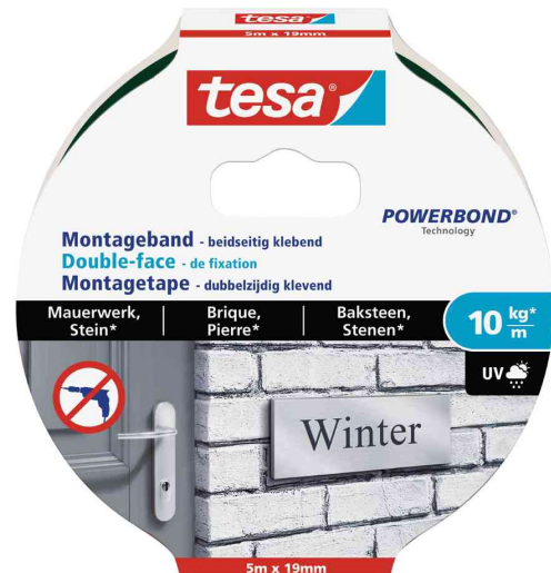
Powerbond® Adhésif double face de montage - pour brique & pierre, 5,0 m