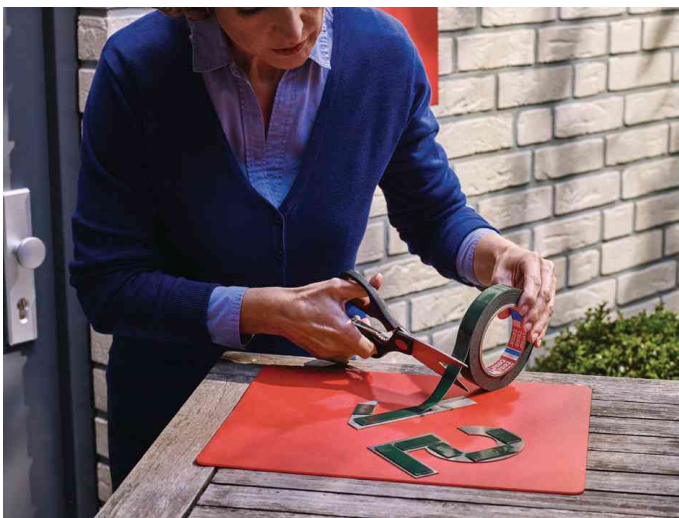
Visuel de référence: montre le produit en utilisation