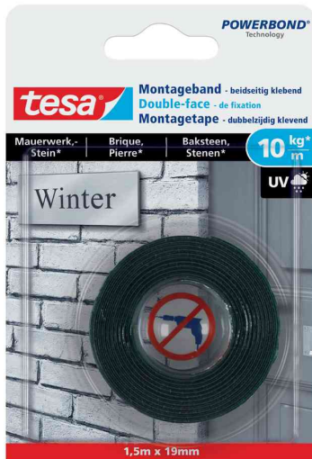
Powerbond® Adhésif double face de montage - pour brique & pierre, 1,5 m