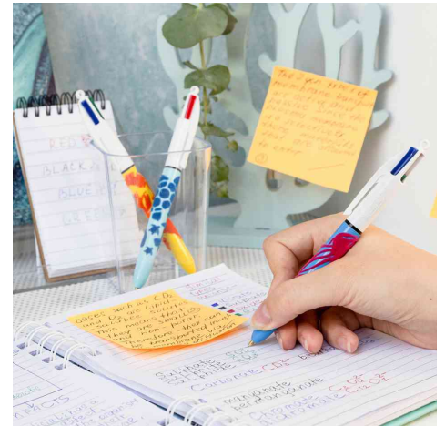
Stylo à bille rétractable 4Couleurs Velours, présentoir de 30