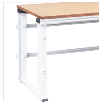
Tischgestell elektrisch höhenverstellbar über 4 hochwertige Linearführungen. Nivellierfüße mit 10-mm-Einstellbereich. 720 mm bis 1100 mm