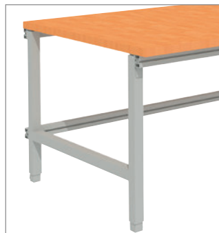
Tischgestell manuell höhenverstellbar über Verschraubung im Höhenraster von 20 mm. Nivellierfüße mit 20-mm-Einstellbereich. 720 mm bis 1020 mm