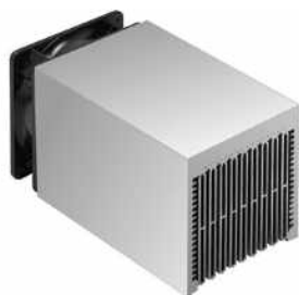
Lüfteraggregate>Lüfteraggregate mit Axiallüfter 120 x 120 mm, mit Axiallüfter