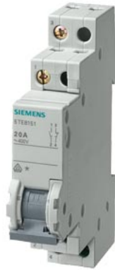
Wechselschalter 20A 3S 1Ö