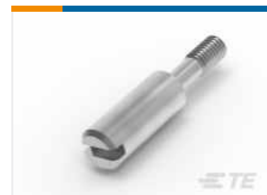
TE Teilnr.:T0931003003-000 CODING-PIN-M3