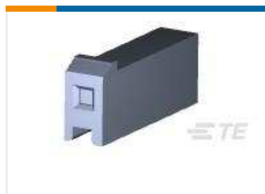
TE Teilnr.:640250-1 01P SL156 HSG W/LCK RAMP NATL