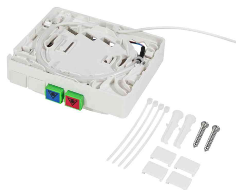
Visuel de référence : Boîte d'épissure FTTH avec câble d'installation, 2x SC / APC