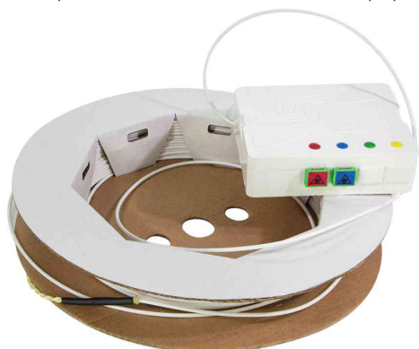
Visuel de référence : Boîte d'épissure FTTH avec câble d'installation, 2x SC / APC