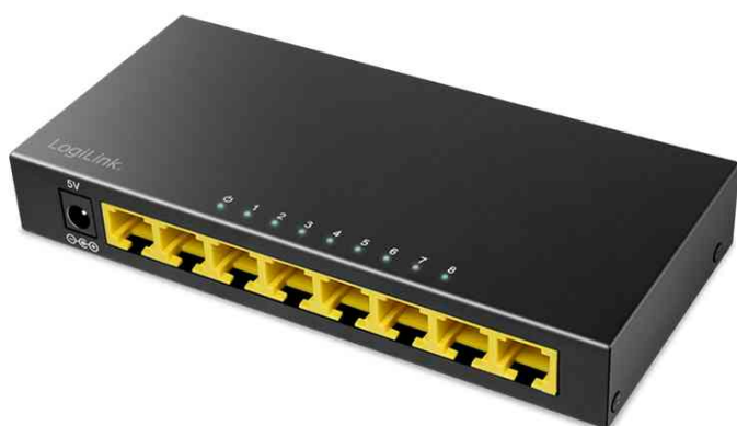
Switch de bureau Gigabit Ethernet, 8 ports

Contenu : switch de bureau Ethernet Gigabit, adaptateur secteur 5 V DC, mode d'emploi