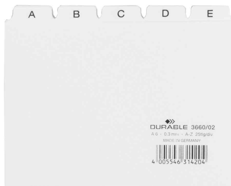
Karteiregister A - Z, weiß