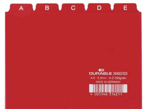
Karteiregister A - Z, rot