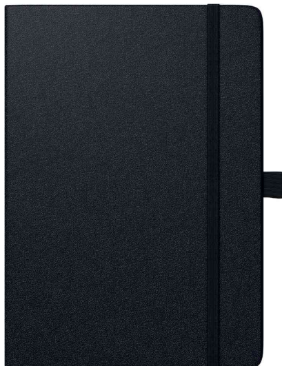
Buchkalender "Conform Balacron", schwarz