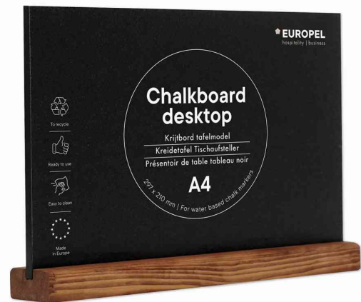
Kreidetafel Tischaufsteller, DIN A4 quer, natur