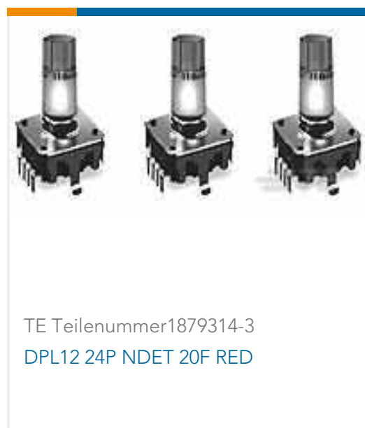
TE Teilenummer1879314-3 DPL12 24P NDET 20F RED