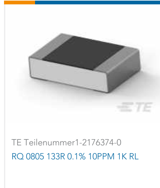
TE Teilenummer1-2176374-0 RQ 0805 133R 0.1% 10PPM 1K RL