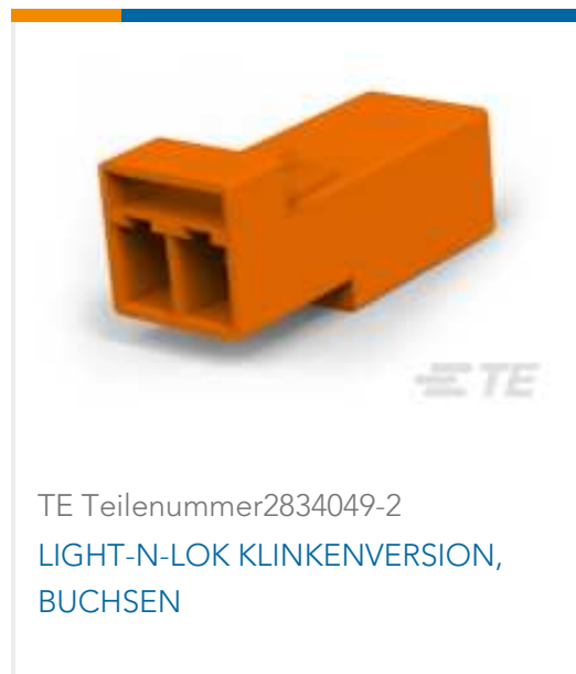
TE Teilenummer2834049-2 LIGHT-N-LOK KLINKENVERSION, BUCHSEN