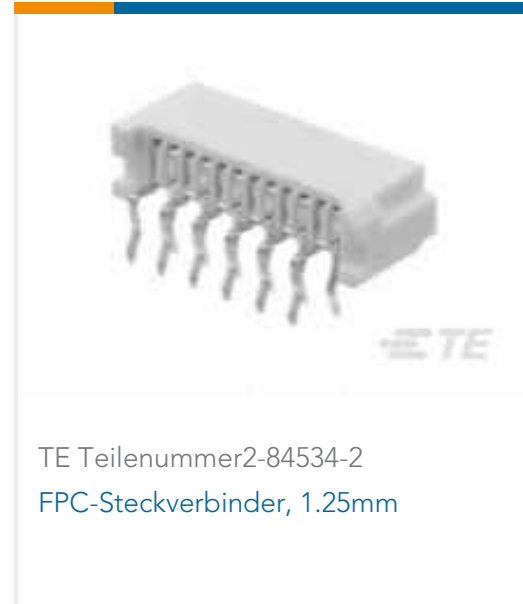
TE Teilenummer2-84534-2 FPC-Steckverbinder, 1.25mm