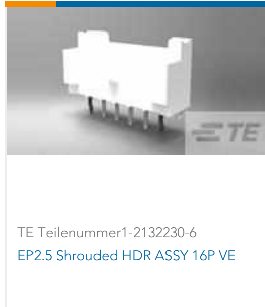
TE Teilenummer1-2132230-6 EP2.5 Shrouded HDR ASSY 16P VE