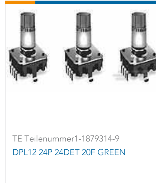
TE Teilenummer1-1879314-9 DPL12 24P 24DET 20F GREEN