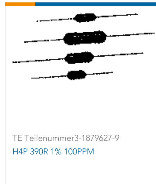
TE Teilenummer3-1879627-9 H4P 390R 1% 100PPM