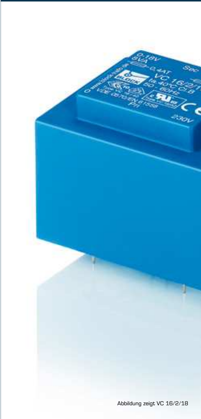
Abbildung zeigt VC 16/2/18