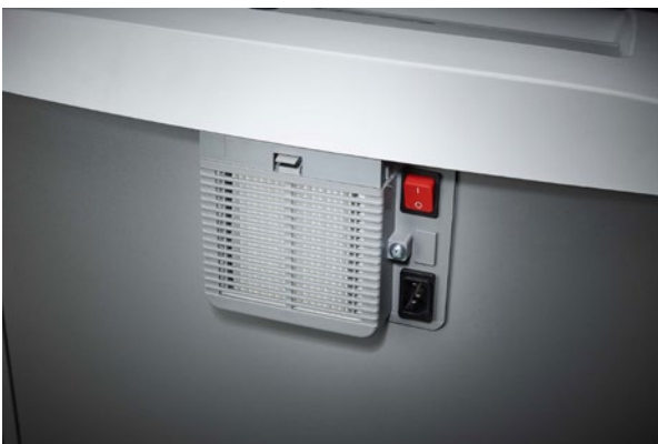
Dahle Aktenvernichter Waste 116air