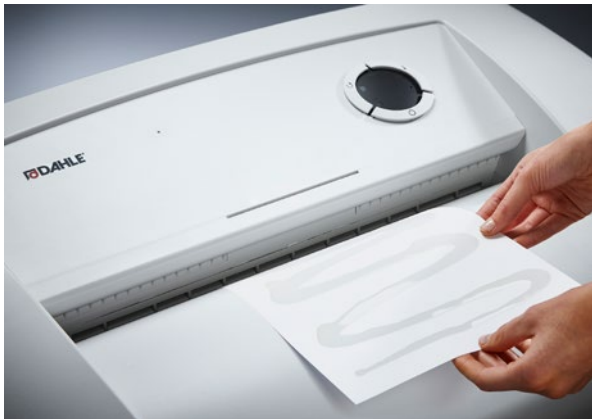
Dahle Aktenvernichter Waste 116air