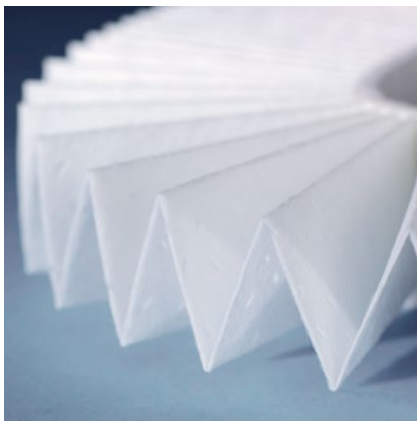
Umweltfreundlicher Filter aus 3-lagigem, vollständig recyclebarem Spezialvlies