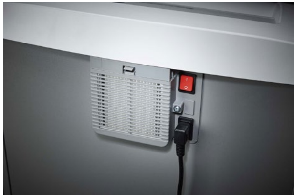
Dahle Aktenvernichter Waste 116air