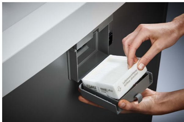
Dahle Aktenvernichter Waste 116air