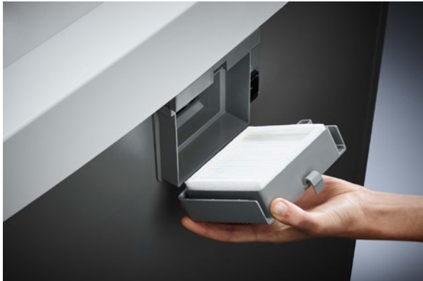
Dahle Aktenvernichter Waste 116air