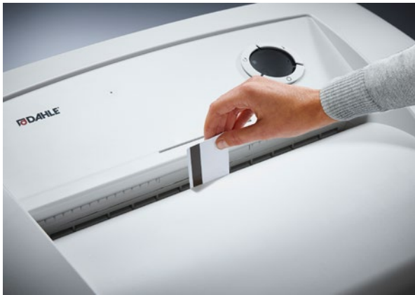
Dahle Aktenvernichter Waste 116air