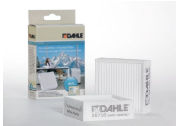
Feinstaubfilter Dahle 20710