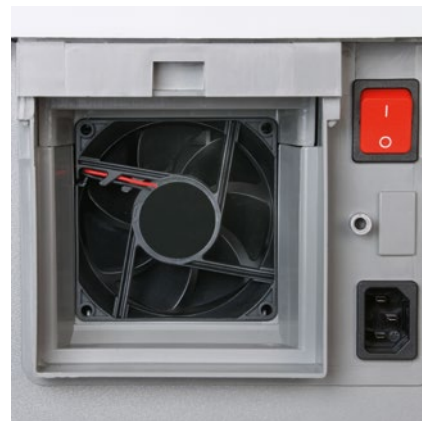
Leistungsstarker Ventilator saugt die Feinstaubpartikel im Inneren des Aktenvernichters an und leitet sie zum Filter