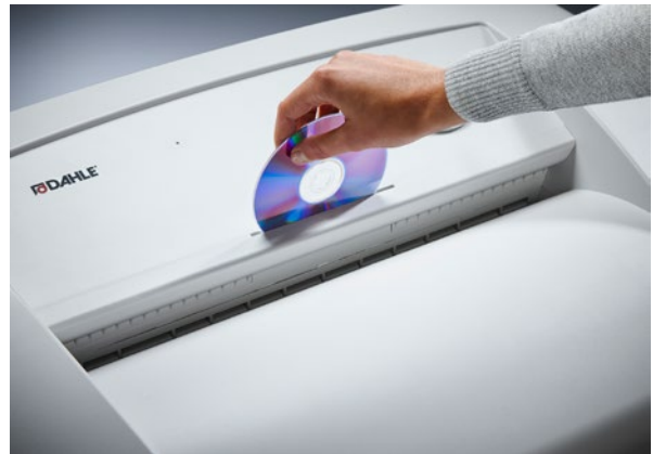
Dahle Aktenvernichter Waste 116air