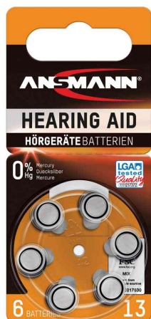
Pile bouton pour appareils auditifs, type 13