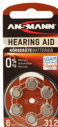
Pile bouton pour appareils auditifs, type 312