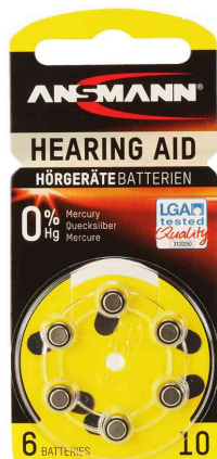
Pile bouton pour appareils auditifs, type 10