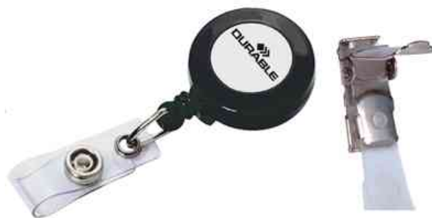
Accessoires: porte-badge - pince de recharge