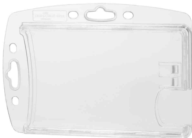
Porte-badge double, avec encoche