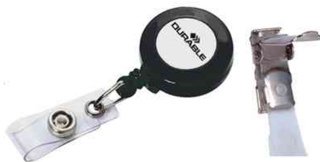
Accessoires: porte-badge - pince de recharge