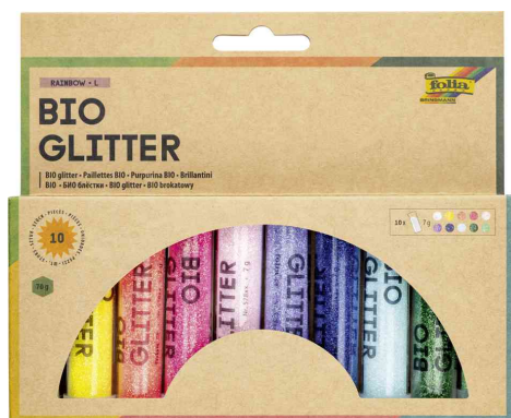
Mélange de paillettes BIO RAINBOW L

- idéal pour décorer vos cartes de voeux, vos créations d'art plastique, votre aménagement intérieur et bien plus encore