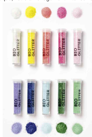
Mélange de paillettes BIO RAINBOW L, contenu