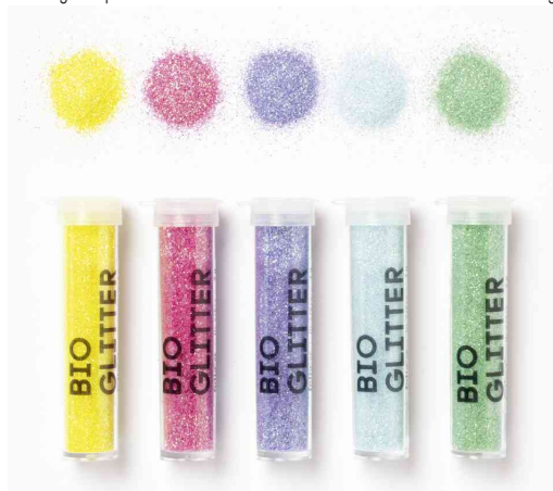
Mélange de paillettes BIO RAINBOW M, contenu