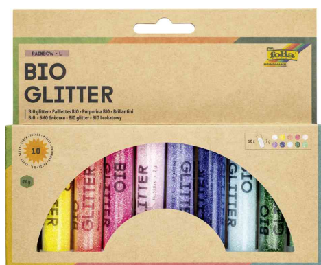
Mélange de paillettes BIO RAINBOW L

- idéal pour décorer vos cartes de vœux, vos créations d'art plastique, votre aménagement intérieur et bien plus encore