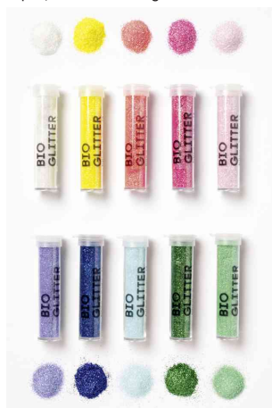
Mélange de paillettes BIO RAINBOW L, contenu