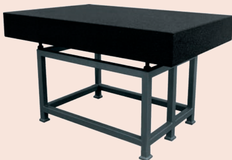
Gránitsík állvánnyal (opció)