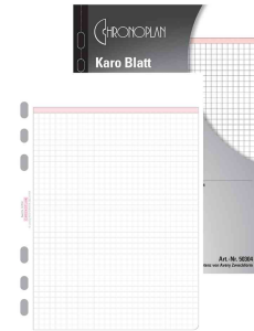
(3) feuille à carreau