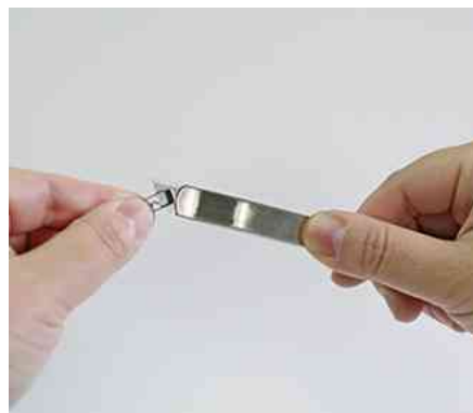
Visuel de référence : montre le casse-lame