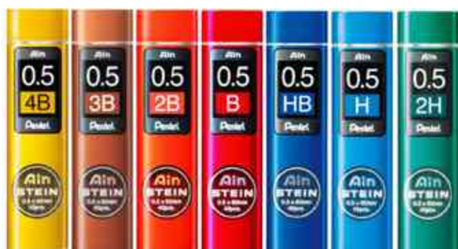
visuel de référence: Porte-mines AIN STEIN - 0,5 mm