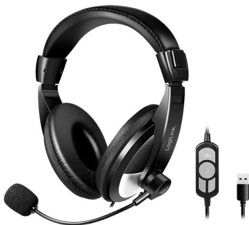
Casque audio stéréo avec commande