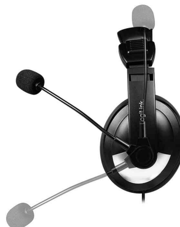
Microphone pivotant à 180°