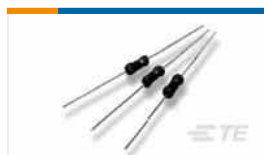
TE Teilnr.:4-1879350-2 RR01 5% 11R AMMO