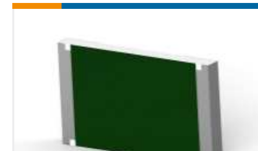
TE Teilnr.:8-2176407-8 3560 27R 5%