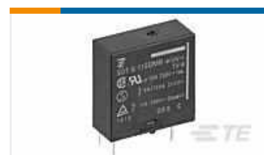
TE Teilnr.:8-1419125-5 SDT-S-106LMR,000