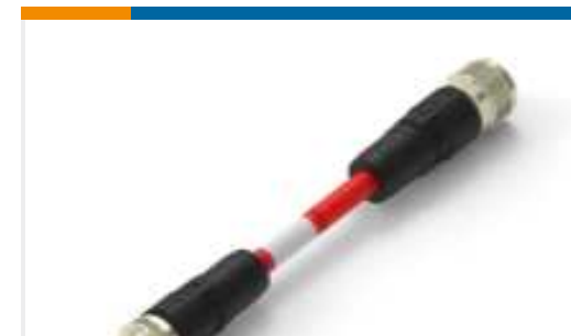
TE Teilnr.:TAA545B1411-060 M12A4-MS-FS-PVC-6.0M