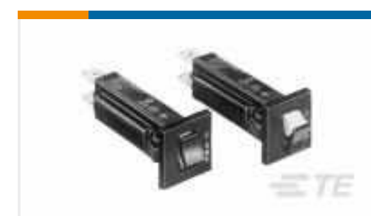
TE Teilnr.:1-1393250-7 W28-XQAT-15=W28