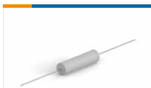
TE Teilnr.:4-2176414-8 7W STD M/OX 5% 1K8