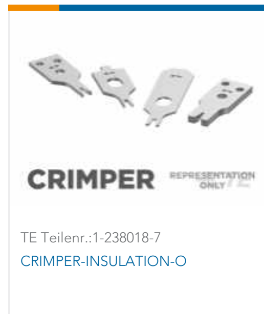
TE Teilnr.: 1-238018-7 CRIMPER-INSULATION-O