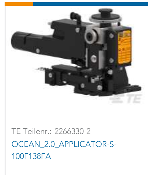
TE Teilnr.: 2266330-2 OCEAN_2.0-APPLICATOR-S-100F138FA