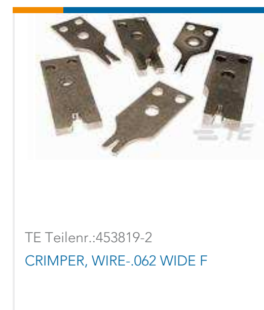
TE Teilnr.: 453819-2 CRIMPER, WIRE-.062 WIDE F