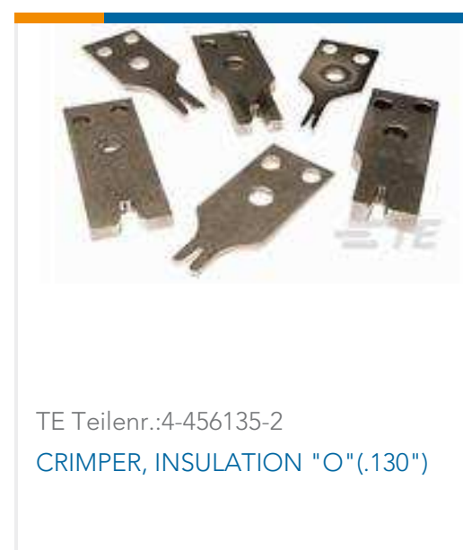
TE Teilnr.: 4-456135-2 CRIMPER, INSULATION "O" (.130")