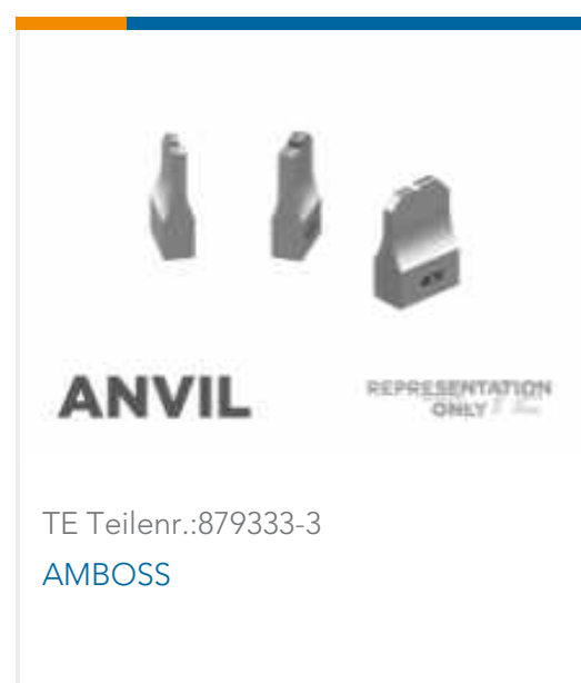
TE Teilnr.: 879333-3 AMBOSS