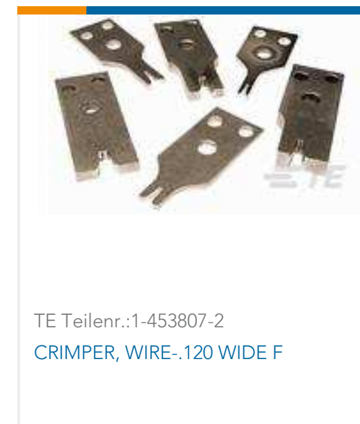
TE Teilnr.: 1-453807-2 CRIMPER, WIRE-.120 WIDE F