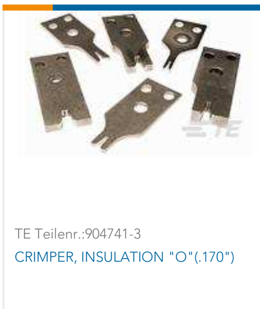
TE Teilnr.: 904741-3 CRIMPER, INSULATION "O" (.170")