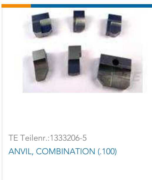
TE Teilnr.: 1333206-5 ANVIL, COMBINATION (.100)