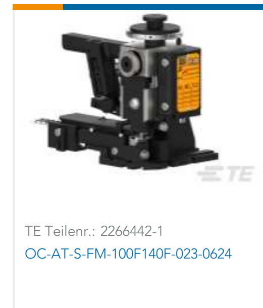
TE Teilnr.: 2266442-1 OC-AT-S-FM-100F140F-023-0624