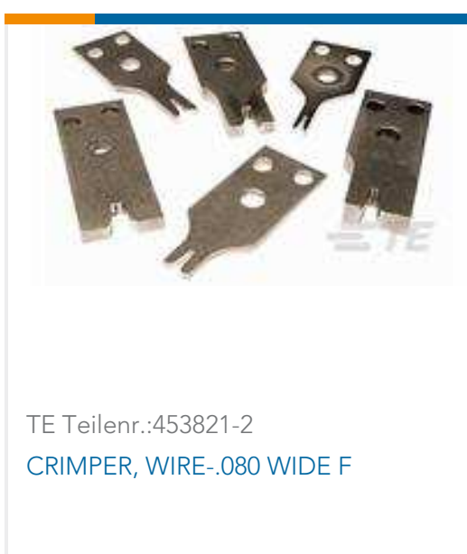
TE Teilnr.: 453821-2 CRIMPER, WIRE-.080 WIDE F