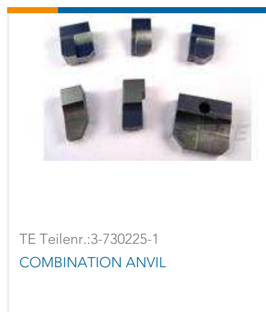
TE Teilnr.: 3-730225-1 COMBINATION ANVIL