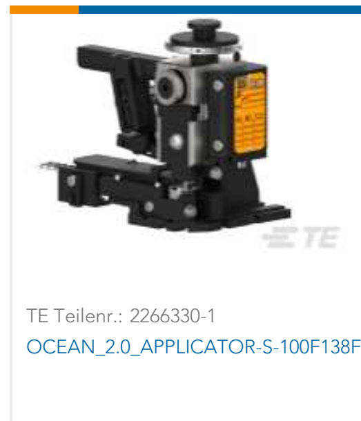
TE Teilnr.: 2266330-1 OCEAN_2.0-APPLICATOR-S-100F138F