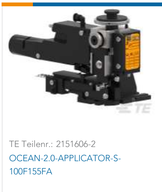
TE Teilnr.: 2151606-2 OCEAN-2.0-APPLICATOR-S-100F155FA