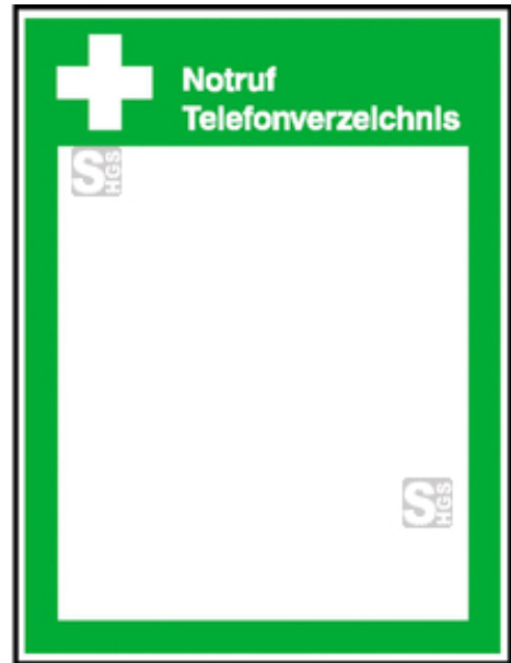
Modellbeispiel: Schild zum Aushang Notruf Telefonverzeichnis (Art. 43.0046)

Unser Tipp: Auf Anfrage auch mit Eindruck nach Ihren Vorgaben erhältlich.