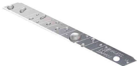
Lame de rechange BA-300

- convient pour les cutters : STL-ONE, FA-120P, iA-120P, iA-200SP, S-202P, S-203P, K-200, K-200RP, eA-300, iA-300RP, A-250RP, A-300, A-300P, A-300R, A-300RP, A-301RP, A-300GR, A-300GRP, AR-1P, A-551P, A553P, A-1000RP, A-1P, AD-2P, MNCR-A1, PMGA-EVO1, PMGA-EVO2, AR2P - conditionnement = 6 pièces dans un étui