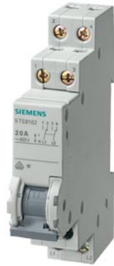
Wechselschalter 20A 2W