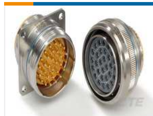
TE TeilenummerZPF000000000007500 983-0SE 10-06 P6