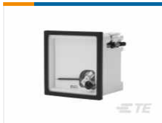
TE TeilenummerD31415-000 CI-E243-41SGRNAJAJ