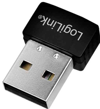
WLAN Dual-Band USB 3.0 Adapter