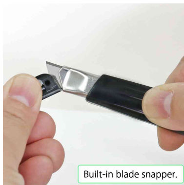
Visuel de référence : montre le produit en utilisation

Light-duty cutter made of recycled resin for the most part.