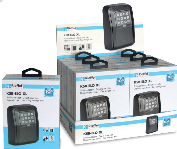
6 er Display offen Présentoir ouvert