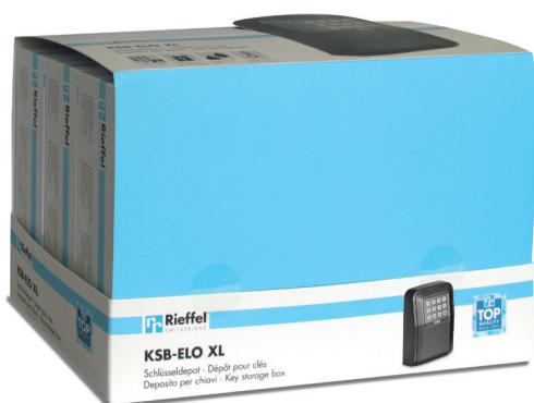
6 er Display geschlossen Présentoir fermé