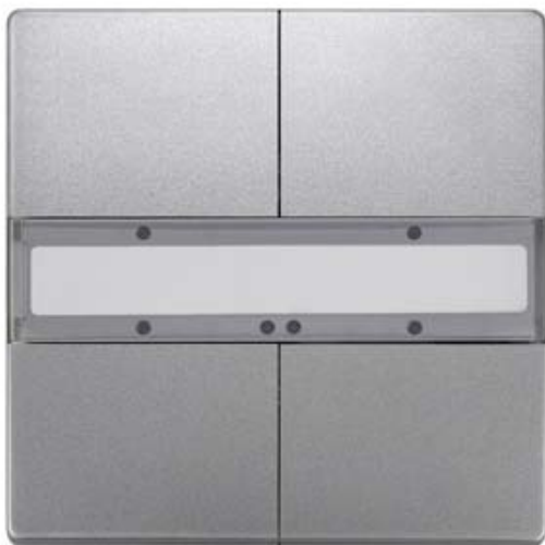
GAMMA INSTABUS TASTER 2-FACH UP 286/2 DELTA STYLE PLATINMETALLIC