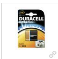
Duracell Ultra Lithium 223 (CR- P2) BG1