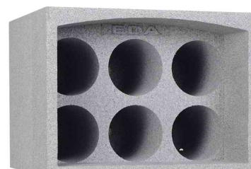
Porte-bouteilles, pour 6 bouteilles