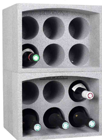
Visuel de référence : porte-bouteilles empilables (livré non garni)