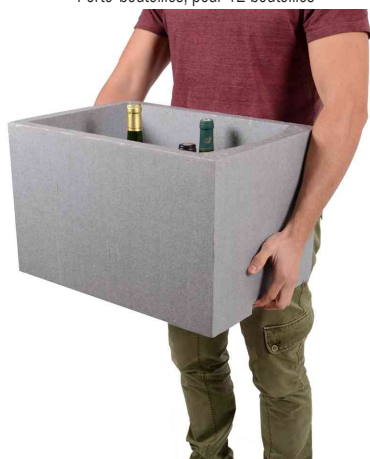
Visuel de référence : montre l'utilisation comme boîte de transport