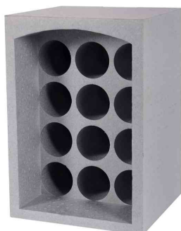
Porte-bouteilles, pour 12 bouteilles