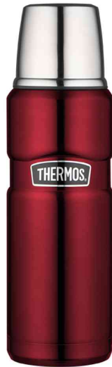
Isolierflasche STAINLESS KING, rot