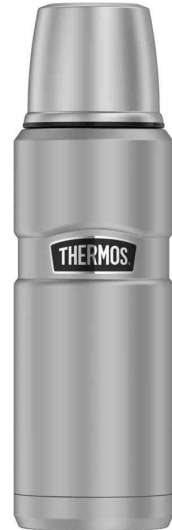
Isolierflasche STAINLESS KING, silber