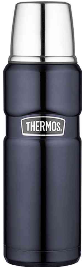
Isolierflasche STAINLESS KING, dunkelblau