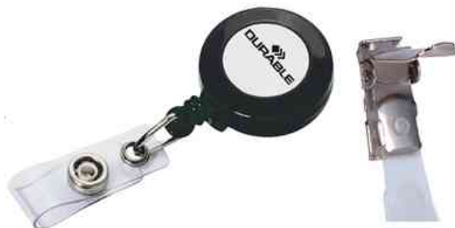
Accessoires: porte-badge - clip de rechange